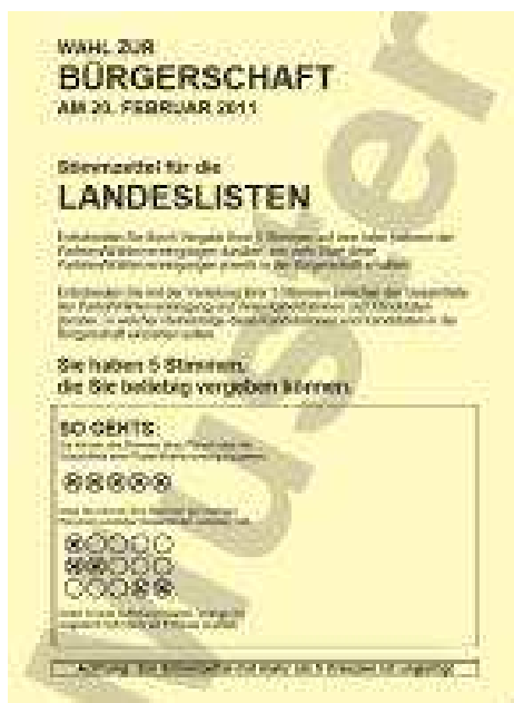
I. mynd: Leiðbeingarsíða um kjörseðil í Hamborg.

Kjörseðlar eru því tveir og það heilar bækur, 16-32 bls. hvor. Hvert framboð fær a.m.k. eitt blað í hvorri kjörbókinni. Á I. mynd er sýnishorn af leiðbeingarsíðu sem er fremst í kjördæmiskjörbók.